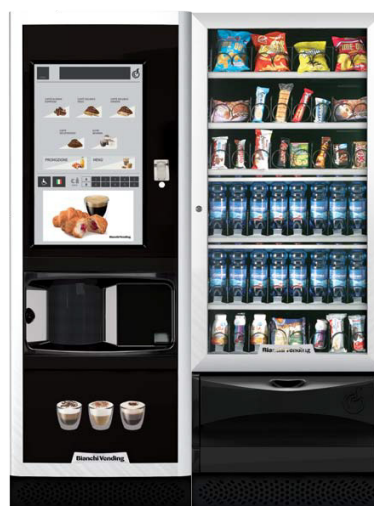
LEI700 PLUS 2CUPS + VISTA L SLAVE