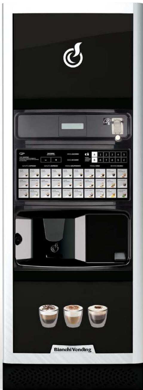
LEI700 PLUS SMART

LEI700 PLUS 2CUPS JE AUTOMATICKÝ VENDINGOVÝ STROJ PRO HORKÉ NÁPOJE O KAPACITĚ 900 KELÍMKŮ. NEJVYŠŠÍ TŘÍDA ŘADY LEI S MOŽNOSTÍ VYUŽITÍ MALÝCH A VELKÝCH KELÍMKŮ V JEDNOM STROJI.