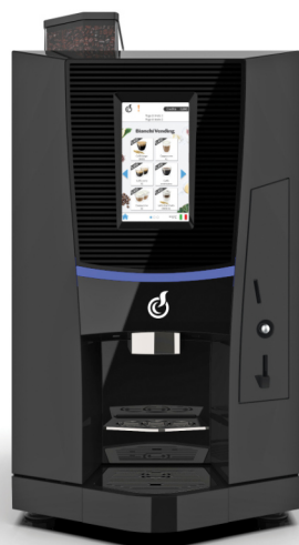
TALIA TOUCH 7"

TALIA JE POLOAUTOMATICKÝ NÁPOJOVÝ AUTOMAT. NABÍZÍ KREATIVNÍ A KOMPLETNÍ ŘEŠENÍ V OBLASTI KÁVY A SPOLEČNĚ SE SVÝM DESIGNEM JE SCHOPNÝ VYLEPŠIT VZHLED JAKÉHOKOLIV PROSTORU VAŠÍ KANCELÁŘE. DOSTUPNÝ VE VERZI ESPRESSO NEBO INSTANT.