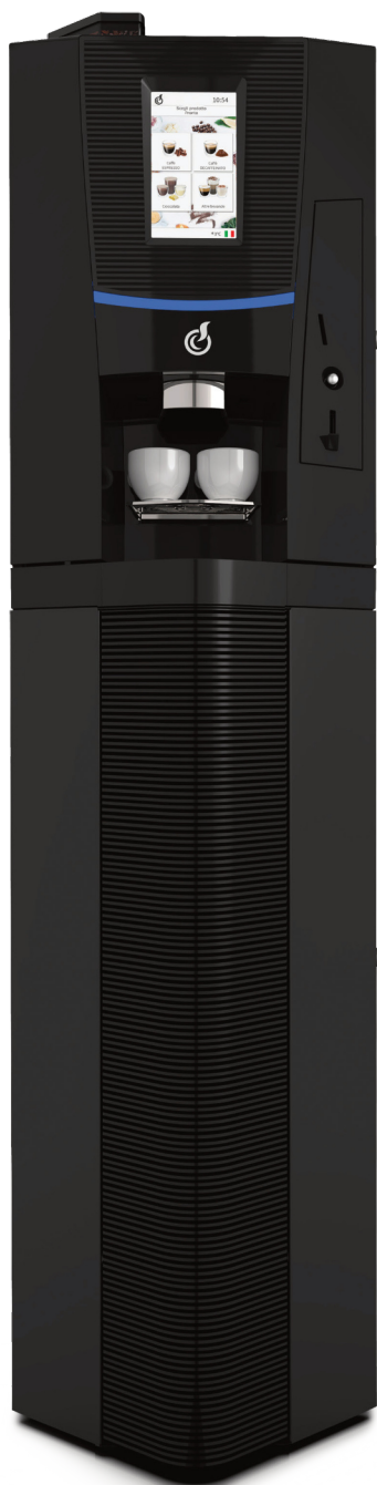
TALIA TOUCH 7" + BLACK CABINET